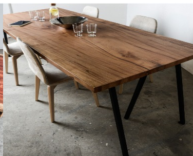
PLATANO (mod. 104)