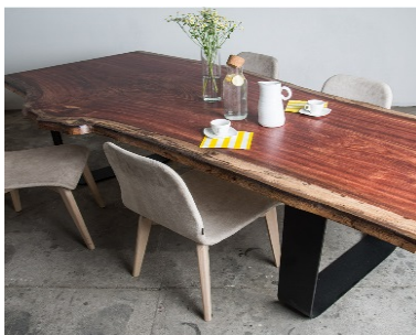
BUBINGA (mod. 103)