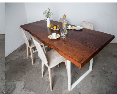
LITCHI (mod. 109)