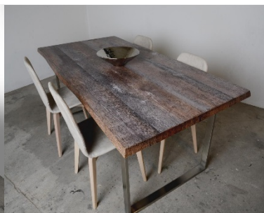
GRIS ARTEMISA (mod. 23)