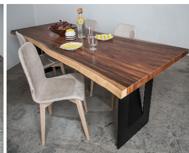
ACACIA (mod. 108)