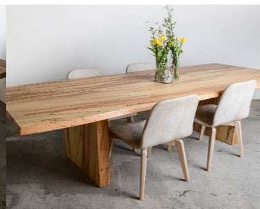
HAYA (mod. 105)