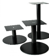
PATA REDONDA NEGRA