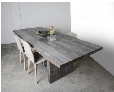
MINA DE PLATA (mod. 05)