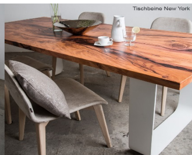
TEJO (mod. 100)