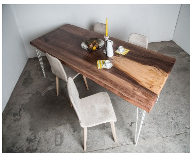
NOGAL EUROPEO (mod. 107)